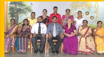
NVA Vereinsmitglieder und Lehrer