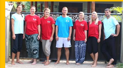
Freiwillige Helfer in Sri Lanka